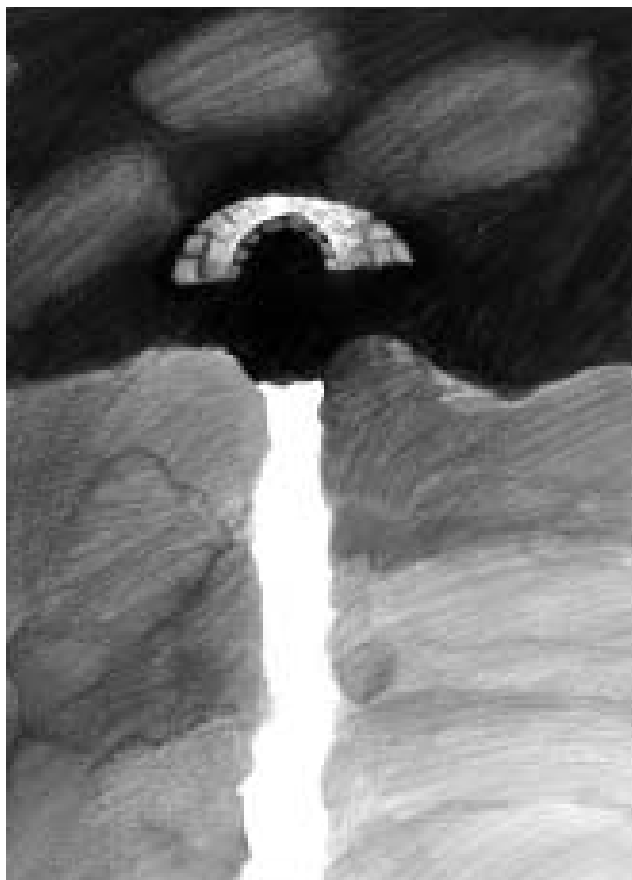
Otázka nad řekou