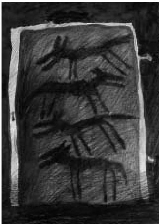
Vlci v brance