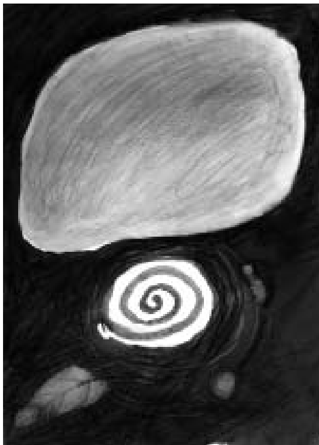
Pohádky o hadech